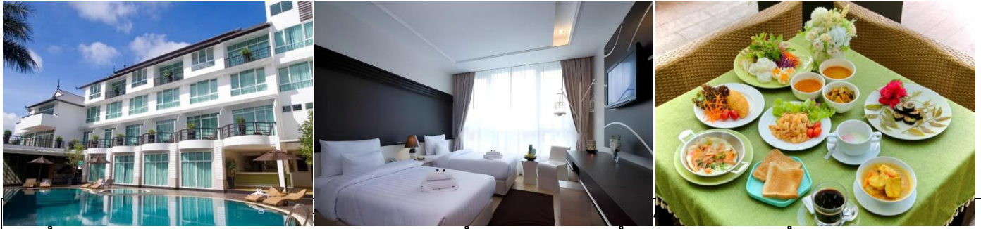
กาแฟชุมพร – สุราษฎร์ธานี